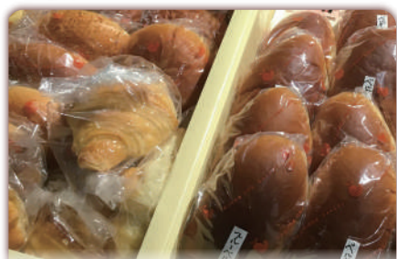
山田湾ベーカリー 様