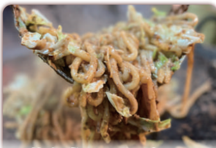
八満食堂 コレコウジツ 様