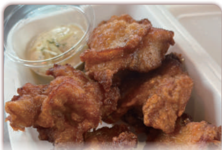
笑福食堂 稲背 様